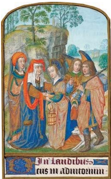
Sara e Tobia ricevuti da Anna Libro d'Ore di Giovanna I di Castiglia

GLI SPOSI SI DISTACCANO DALLE RISPETTIVE FAMIGLIE PER FORMARNE UNA NUOVA. MA L'AFFERMAZIONE DELLA PROPRIA AUTONOMIA VA INSIEME AL RISPETTO PER IL NUCLEO D'ORIGINE